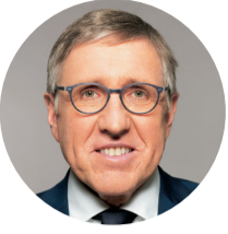
François Bausch Nohaltgkeetsminister, MDDI

„Ee rezente Sondage huet gewisen, dass am leschte Joer 60% vun de Résidents Vélo gefuer sinn. Zesumme mat de Gemenge kenne mir grad den DICI-Raum mat senger dichter a gemëschter Siedlungsstruktur op eng flott Manéier nei erschléissen.“