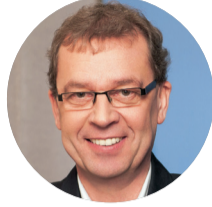
Camille Gira Staatssekretär fir Nohaltg Entwécklung an Ëmwelt

„Ee rezente Sondage huet gewisen, dass am leschte Joer 60% vun de Résidents Vélo gefuer sinn. Zesumme mat de Gemenge kenne mir grad den DICI-Raum mat senger dichter a gemëschter Siedlungsstruktur op eng flott Manéier nei erschléissen.“