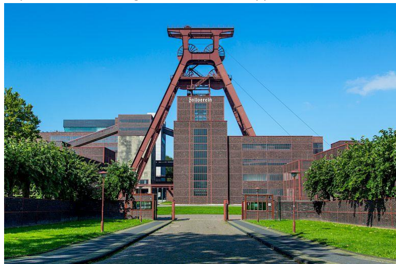
IBA Emscher Park, The Zollverein Mine gateway, 2013

Au cœur de chaque IBA se trouvent plusieurs projets concrets. Ces projets doivent être fédérés autour d'une idée, le Motto . La recherche de cette idée fédératrice est l'objet de la phase de préfiguration, qui détermine la stratégie et pose les bases d'une IBA . La stratégie, les valeurs, les enjeux et les principes communs sont tous à inventer ; c'est pourquoi la préfiguration est propice à un dialogue ouvert et transparent, créatif et expérimental.